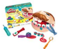
プレイ・ドゥー ねんどではしゃげん こむぎねんど 85520 正規品