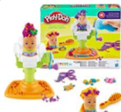
プレイ・ドゥー ゆかいなごやさん

NPO 法人全国ことばを育む会では、米国の玩具メーカー日本法人である「ハズプロジャパン合同会社」から、トイ・ドネーション（販売会社からのおもちゃの返品を廃棄せずに必要としている子ども達に無料で届ける事業）を受け、希望する県に配布する事になりました。