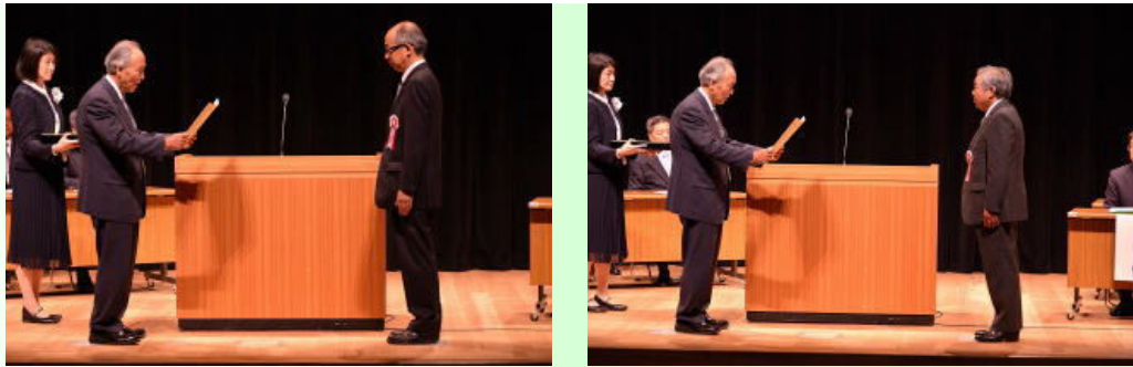
表彰式 岩手県難聴・言語障がい教育研究会とことばを語る会に感謝状を贈呈