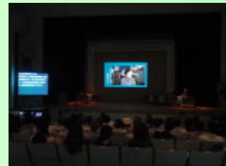
学習会 これまでのことばを育む親の会のあゆみを振り返る